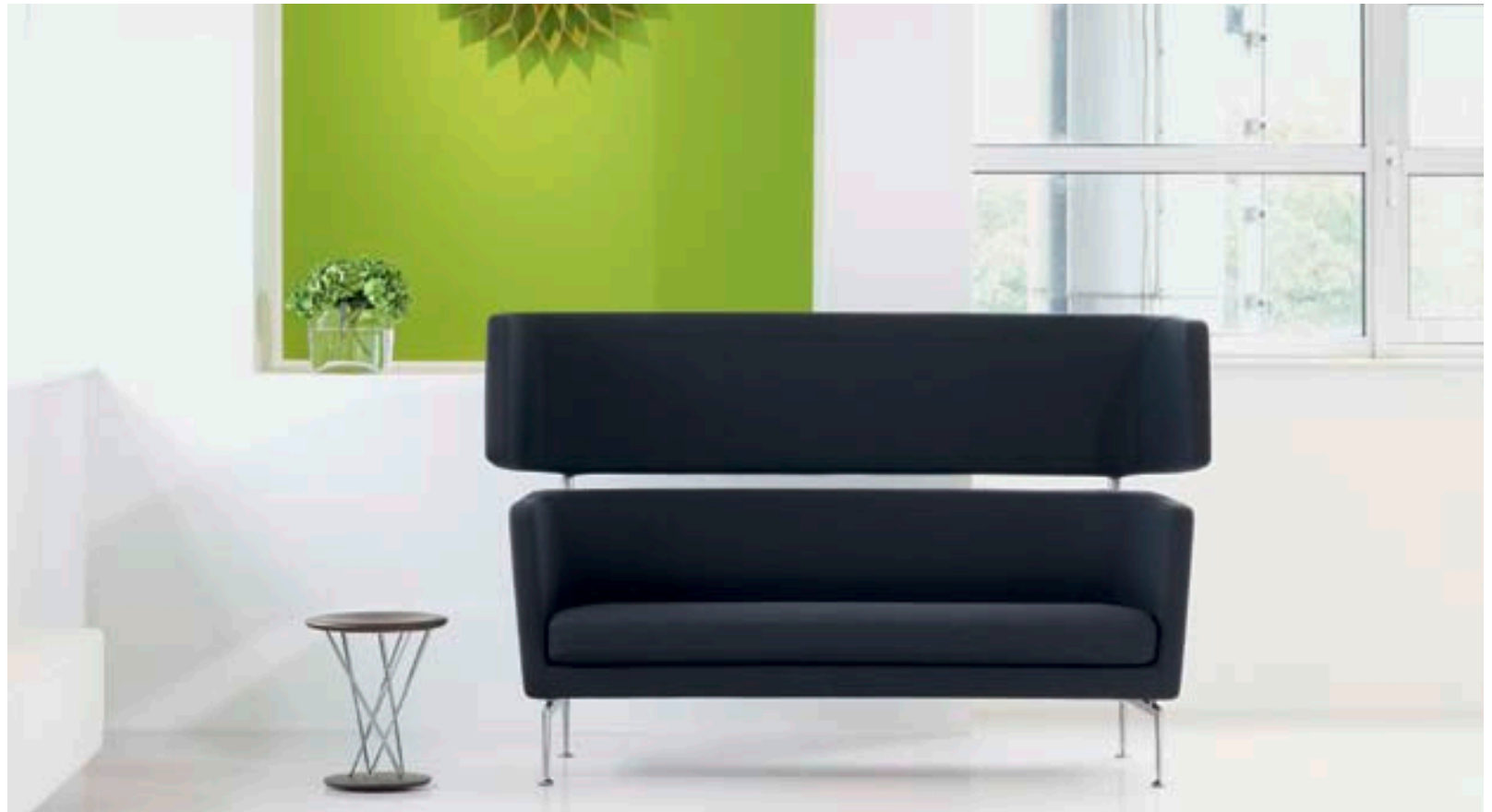
Das Suita Club Sofa ist je nach Bedarf mit oder ohne Kopfteil erhältlich.

Das elegante, zeitlose Suita Sofa-System von Vitra und Antonio Citterio setzt sich aus vielfältigen Komponenten zusammen, die miteinander kombiniert werden können. Auch für den Gebrauch in Büros, Wartezonen und Lobbys wurden zwei Einzelmöbel entwickelt: das Suita Club Sofa und der Suita Club Armchair. Ihre Konstruktion und ihre Beschaffenheit sind auf die hohen Anforderungen des Gebrauchs in Objektbereichen abgestimmt, Polster und Bezug sind von besonders beständiger Qualität. Die Polsterung der Rückenlehne ist so aufgebaut, dass ohne zusätzliche Kissen ein hoher Komfort gewährleistet wird.