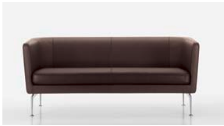
Das Suita Club Sofa und den Armchair gibt es in Stoff oder Leder.