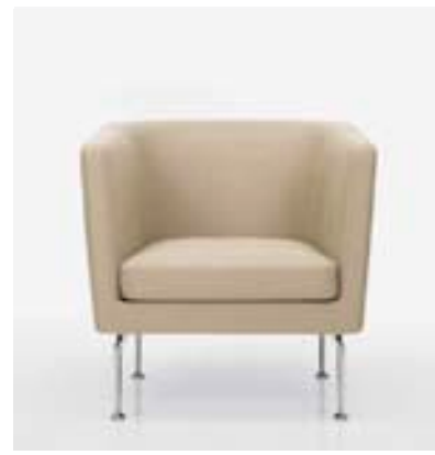
Der kompakte und bequeme Suita Club Armchair ist die ideale Ergänzung zum Sofa.