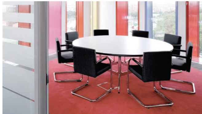
ICADEEMGP, Paris, Frankreich