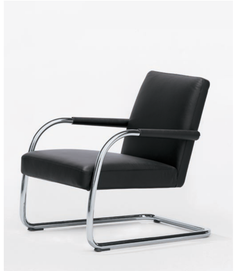
Visasoft und Visalounge sind nicht nur in Leder, sondern auch mit dem hochwertigen Bezugsstoff Wooltop erhältlich.