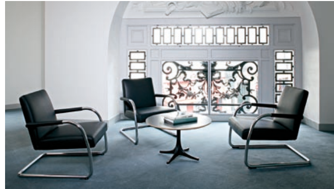
General Electric, Paris, Frankreich