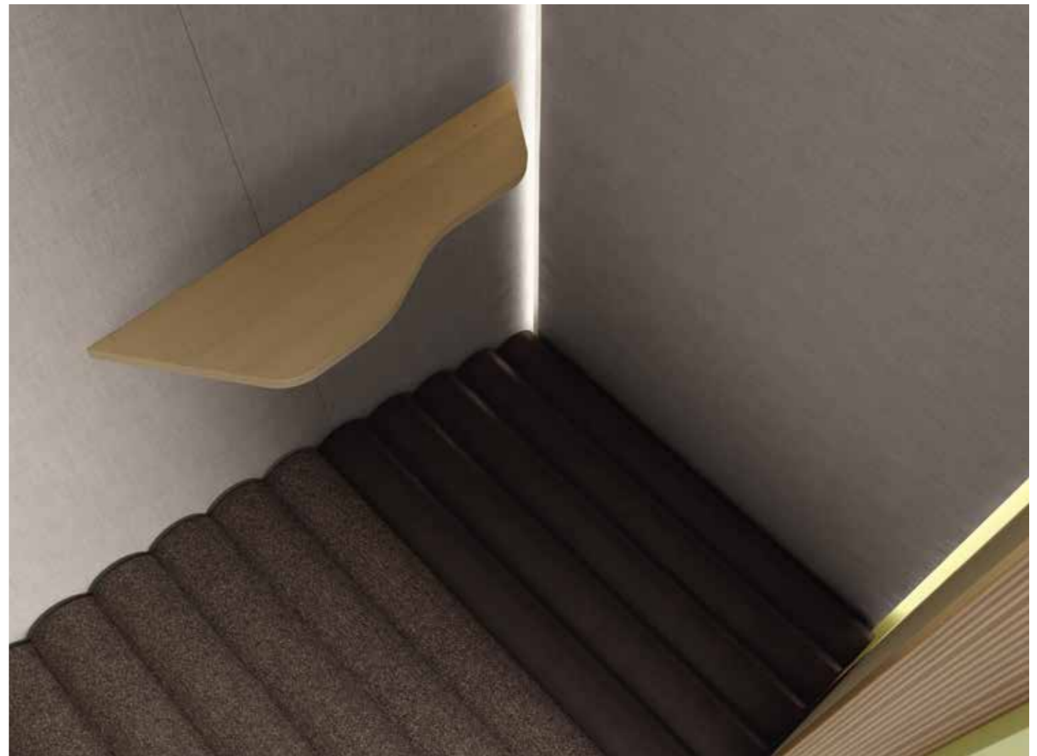
Ordnung muss sein. Das formschöne Tablar bietet eine praktische Ablage für Portemonnaie, Schlüssel oder Mobile Phone.