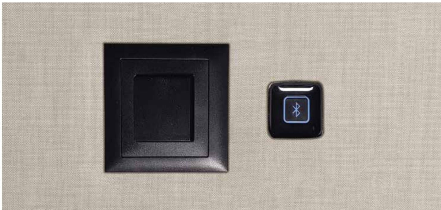
Mittels Bluetooth verbindet man das Mobile Phone mit dem unter der Stoffverkleidung nicht sichtbar eingebauten Lautsprecher oder man bedient sich seiner eigenen Kopfhörer. Lieblingsmusik an und einfach mal abtauchen!