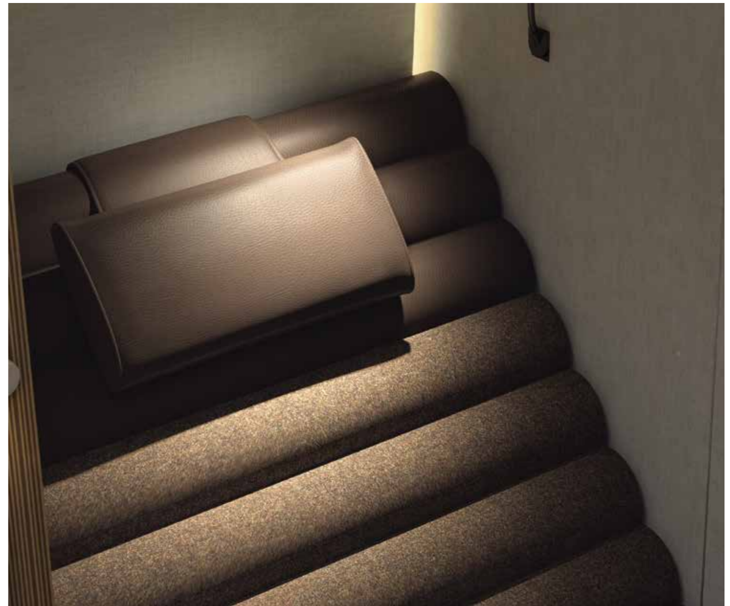
Das ergonomisch geformte, verstellbare Nackenkissen aus Kunstleder ist eine optimale Kopfstütze. Für den erholsamen Kurzschlaf.