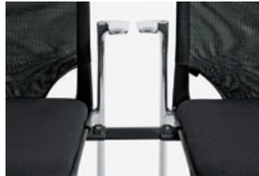
Reihenverbindungen sowie Reihen- und Sitzplatz-Nummierungen sind auf Wunsch erhältlich.