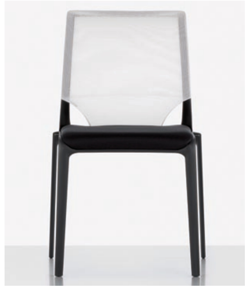
Die elegante Anmutung von MedaSlim wird durch den weissen NetZRücken noch betont.