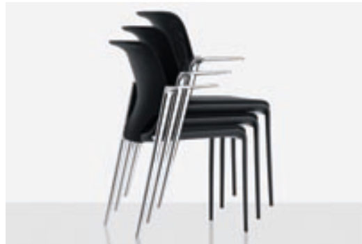
Bis zu 5 MedaSlim mit verchromten Hinterbeinen lassen sich stapeln.