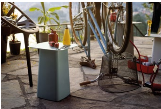
Metal Side Table (Outdoor)

In der pulverbeschichteten Variante mit Feinstruktur sind die Metal Side Tables wetterfeste Beistelltische für Garten und Balkon. Die Tische lassen sich perfekt mit dem drinnen und draussen einsetzbaren Sessel Waver kombinieren, dessen Untergestell in denselben Farben erhältlich ist.